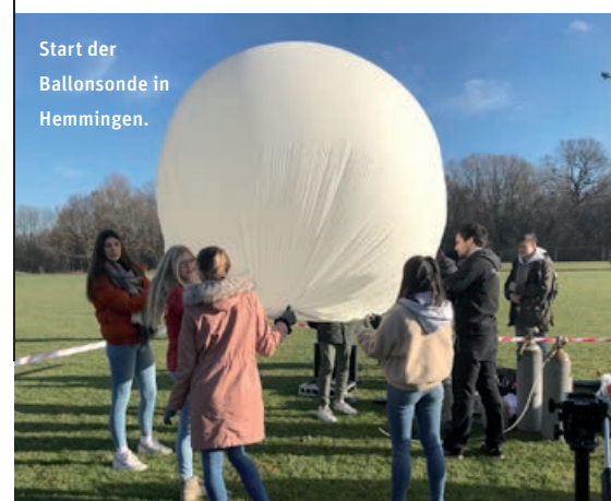
Start der Ballonsonde in Hemmingen.