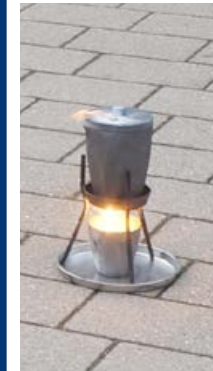
Praxisversuch auf dem Schulhof: Ein Gemisch aus Eisenoxid und Aluminium reagiert unter hoher Wärmeentwicklung. Es entsteht Eisen.