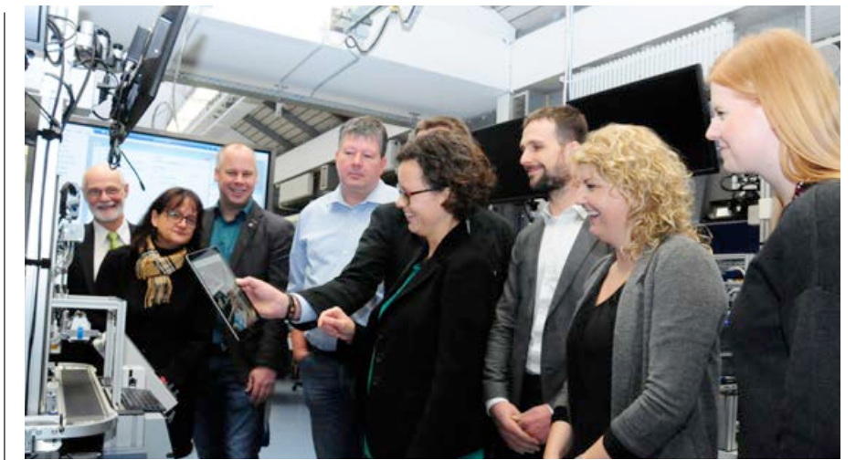
Fertigung in der Berufsschule – die Digitalisierung hält auch hier Einzug.